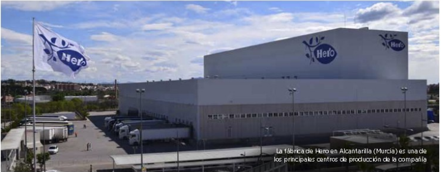
La fábrica de Hero en Alcantarilla (Murcia) es una de los principales centros de producción de la compañía